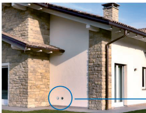
Udvendig er der ingen ude del, kun 2 diskrete spjæld.