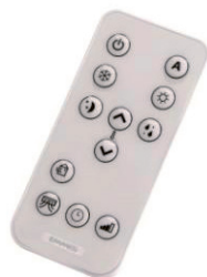
Den trådløse fjernbetjening styrer alle funktioner.